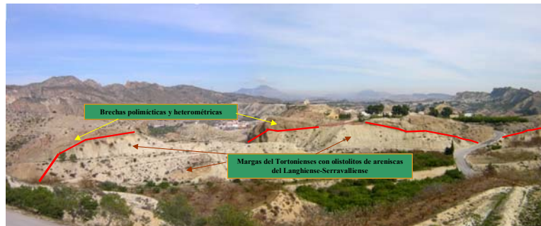
FOTO 51.- Panorámica de la Unidad Olistostrómica desde el mirador de la Sierra del Cajal